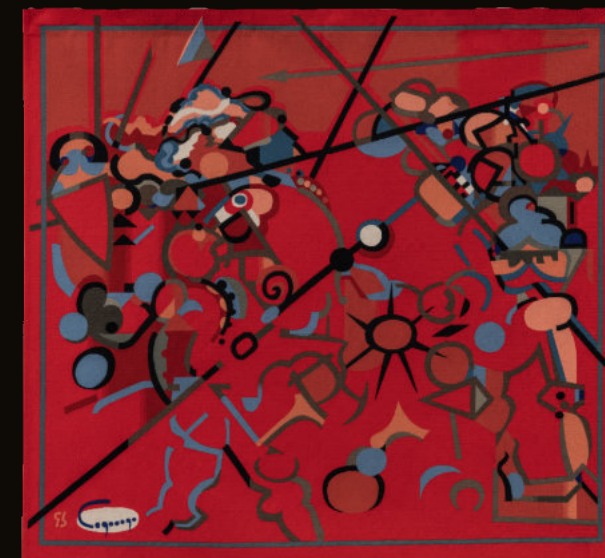
« Bataille carrée » - Jacques Lagrange tapisserie

17 mai > 3 septembre 2023 Moutier d'Ahun (Creuse) 18 rue de la Bergerie