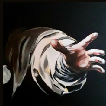
« Le banquet » - Pascal Dejammet

Les œuvres du Caravage furent à l'avant-garde d'un modèle magnifié par la lumière ; qu'il s'agisse de corps, d'étoffes ou d'objets ordinaires, cet éclairage oriente le regard vers une scénographie subtile qui, au-delà de ses références religieuses et mythologiques,