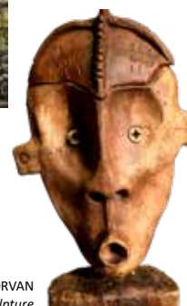
Franck MORVAN sculpture