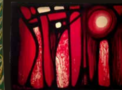
« Tropical » - Marc VAUGELADE tapisserie