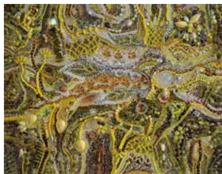
Claire BAILLET peinture