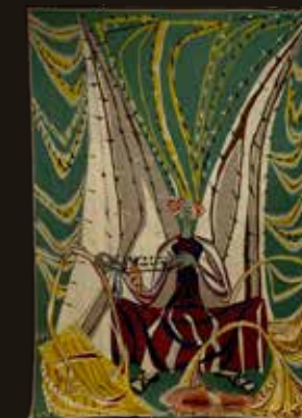
« Retour de pêche » Roger SOMVILLE, TAMAT tapisserie