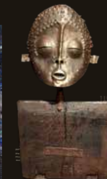
Franck MORVAN sculpture